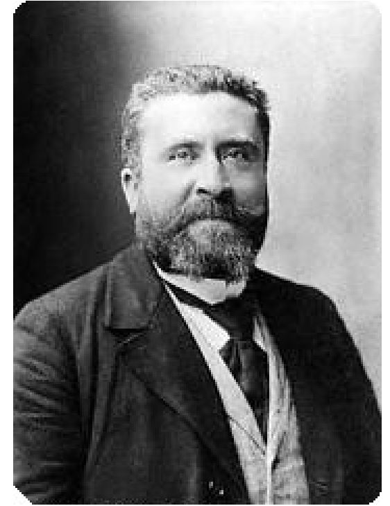
Jean Jaurès en 1904