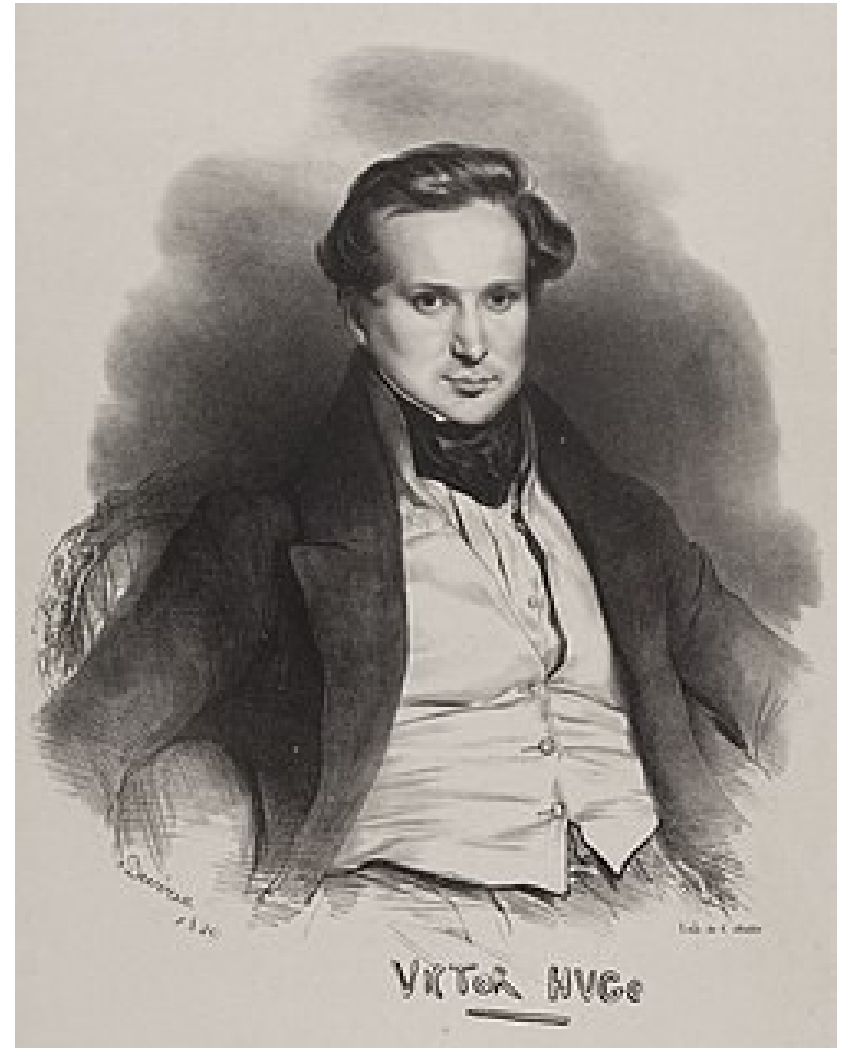
Portrait de Victor Hugo jeune par Achille Devéria en 1829, on peut le voir au musée de Carnavalet. (vikidia)