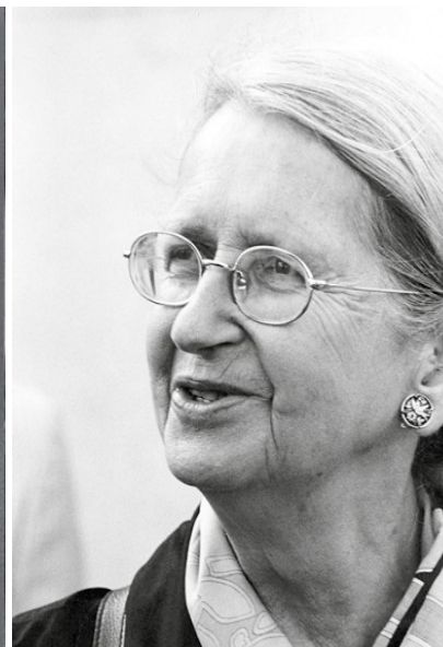
Geniève de Gaulle- Antonioz, vieille