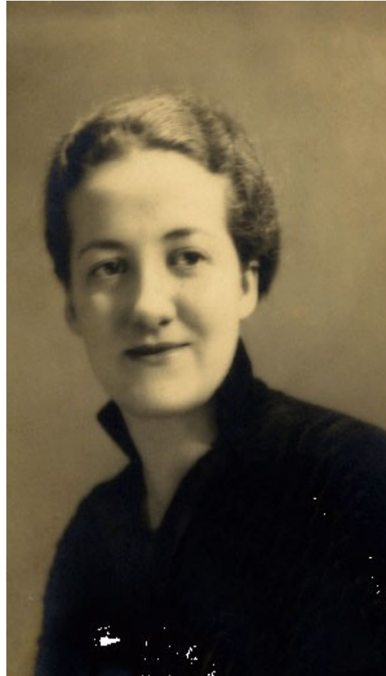
Germaine Tillion

Germaine TILLION est une résistante et ethnologue, née le 30 mai 1907 à Allègre (commune du département de la Haute-Loire). Elle décède le 19 avril 2008 à Saint-Mandé (commune du département Val-de-Marne). C'est une héroïne car elle est résistante, elle envoie des colis, elle libère des prisonniers et recueille de nombreux renseignements sur l'armée allemande. Ses actes héroïques ont été récompensés le 27 mai 2015. Elle a été enterrée en 2015 au Panthéon à Paris. (Vikidia)