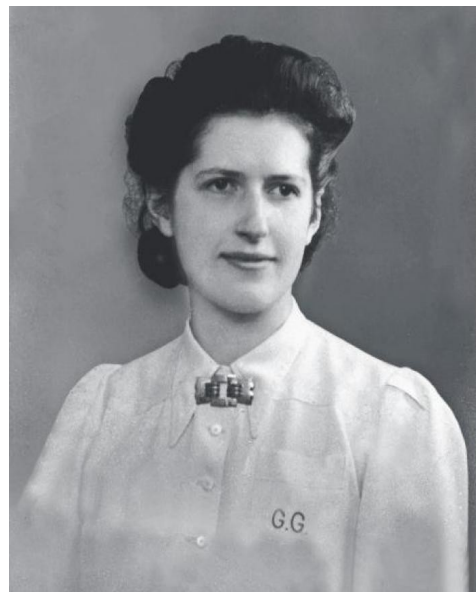
Geniève de Gaulle -Antonioz, jeune