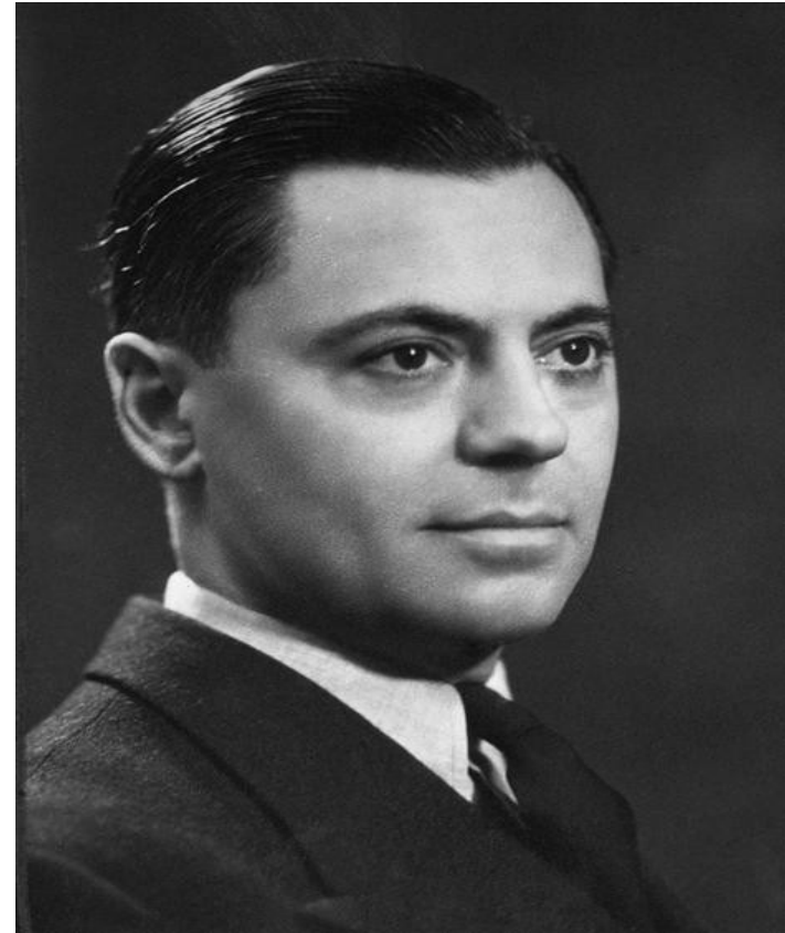
Portrait de Jean Moulin en 1937 par le Studio Harcourt.

Préfet de l'Aveyron puis d'Eure-et-Loir, refusant l'occupation nazie, il rejoint, en septembre 1941 , l'organisation de résistance française . Il est reçu par Charles de Gaulle à qui il fait un compte rendu de l'état de la Résistance en France et de ses besoins, notamment financier et en armement. Jean Moulin est torturé à Lyon et est ensuite transféré dans le train qui le transporte en Allemagne dans lequel il meurt , peu avant le passage de la frontière le 8 juillet 1943 . Son décès est enregistré en gare de Metz.